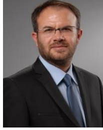
Mustafa AKGEDİK Aladağ Belediye Başkanı